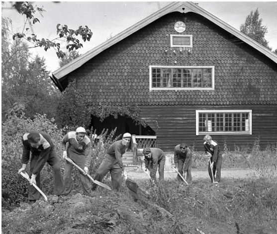
ÖSK:are utför markarbete på Strömsborg.