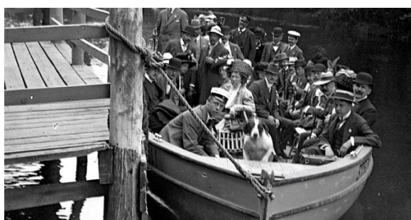
Båtresor till och från Strömsnäs