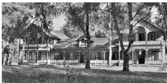
Den stilfulla byggnaden, med den stora verandan, innehåll matsalar och ett antal sovrum på övervåningen.