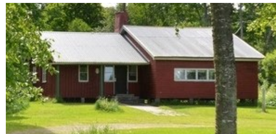
Det tidigare sommarhemmet brann ned, i början av 1950-talet, och ett nytt byggdes, kallat "Kåken".