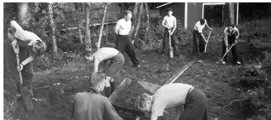
Allt arbete på Strömsnäs, under femtio år, genomfördes av KFUM:s medlemmar.