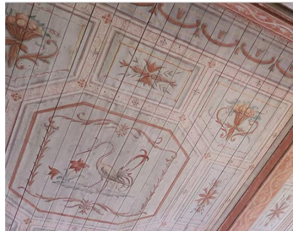
De vackra takmålningarna har återställts vid den nu pågående renoveringen.