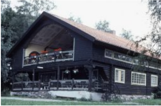
Strömsborg byggdes som café 1921. Under åren 1948-67 drev ÖSK anläggningen.