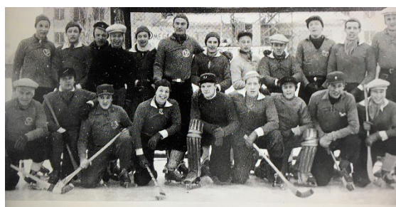
En bandymatch mellan AGF och KFUM, resultatet rapporterades i DN.