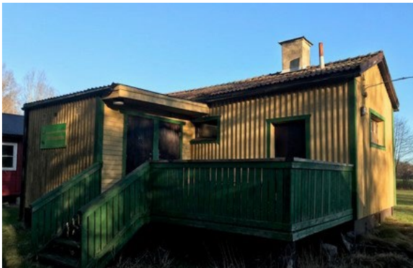
Bastun stod klar 12 juni 1940, den nyttjades väl tillsammans med ett bad i Svartån.