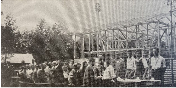
Theodor Dieden upplät marken. Taklagsfest sommaren 1936. Invigning 1937.