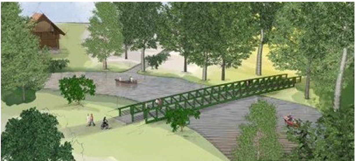
En ny bro över Svartån, till Hästhagen, kommer att färdigställas inför sommaren 2025.