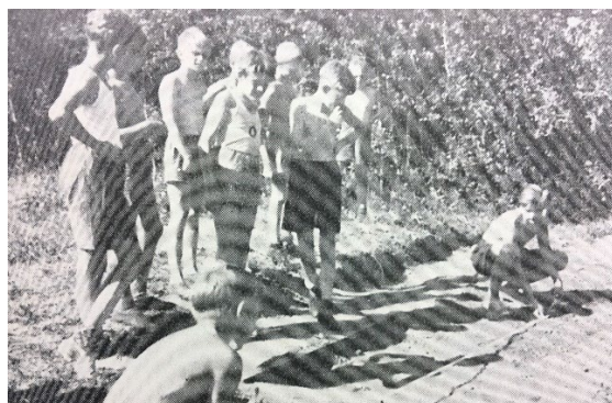
KFUM genomförde idrottskolonier och annan verksamhet fram till 1968. Byggnaden revs 1971.