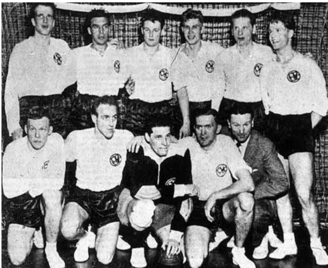
ÖSK SM-vinnare 1956