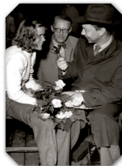
Sven Jerring refererade och Gunnar Helén intervjuade.