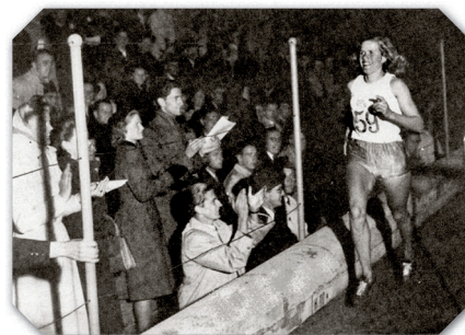
Första kvinnan att springa ärevarv på Stadion.