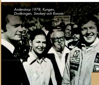
Anderstorp 1978, Kungen, Drottningen, Smokey och Ronnie.

Örebro's internationellt mest kända idrottsman som vann tio Formel 1-lopp på 123 starter. Sveriges främsta racerförare genom tiderna tog två VM-silver på 1970-talet innan en tragisk olycka satte stopp för hans liv och karriär, 34 år gammal. F1-världen minns Ronnie som den kanske bäste föraren som aldrig blev världsmästare. 25 år efter sin död blev Ronnie staty i Örebro och han har även hedrats med en stor utställning och eget museum i hemstaden.