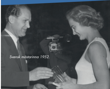
Svensk mästarinna 1952.