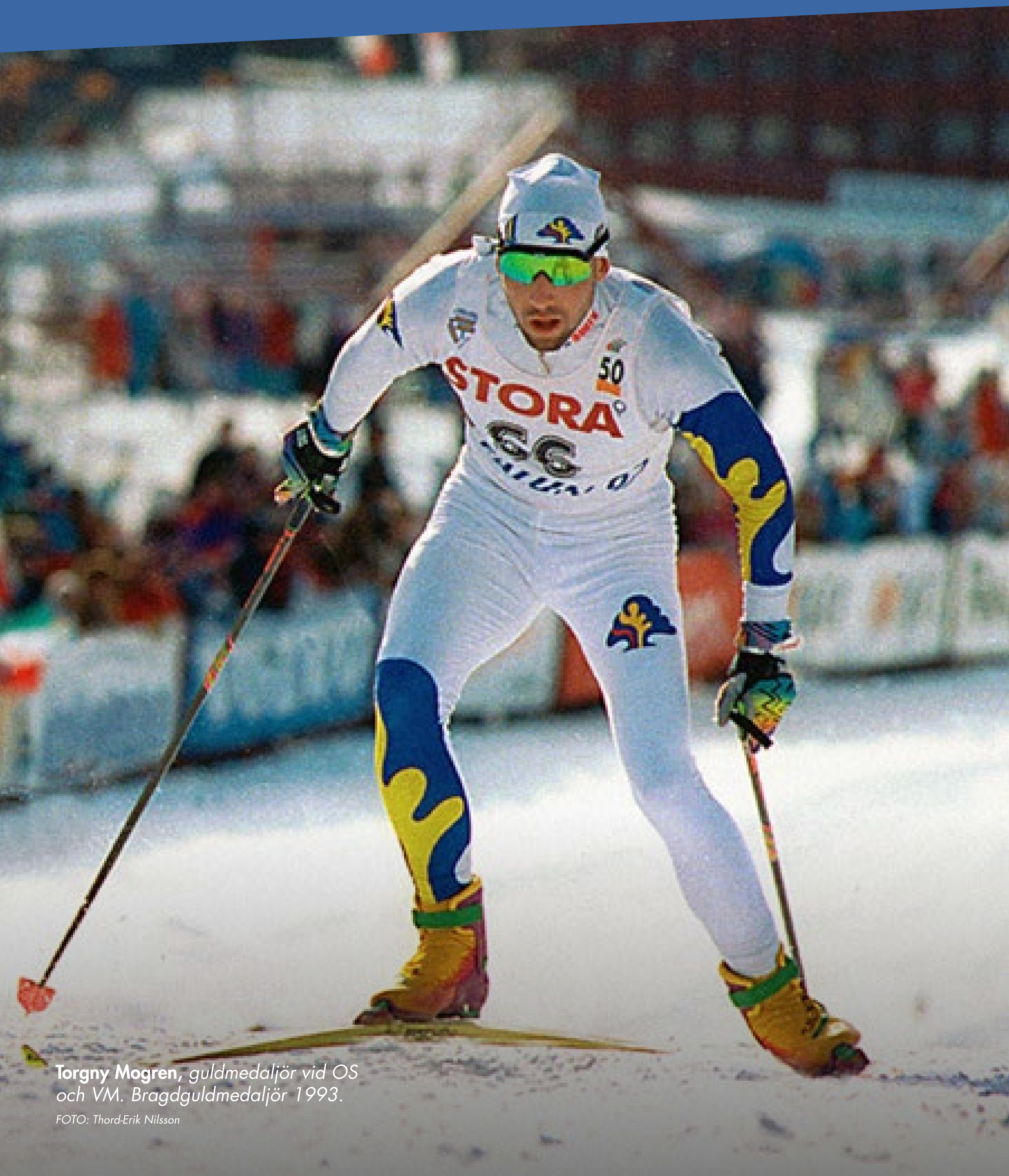
Torgny Mogren, guldmedaljör vid OS och VM. Bragdguldmedaljör 1993.